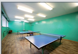
Herna stolního tenisu a malá společenská klubovna