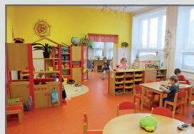
PP Mateřská škola se zázemím