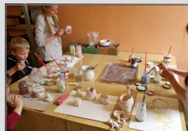
1NP Umělecké kroužky pro MŠ i veřejnost