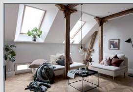
2NP Podkrovní bytová jednotka