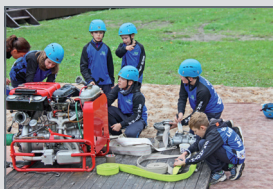
Klubovna mladých hasičů