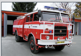
Garáž pro dobrovolné hasiče