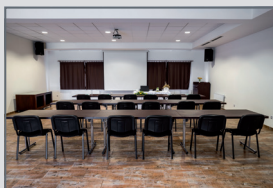
Zasedací a školící místnost obecního úřadu